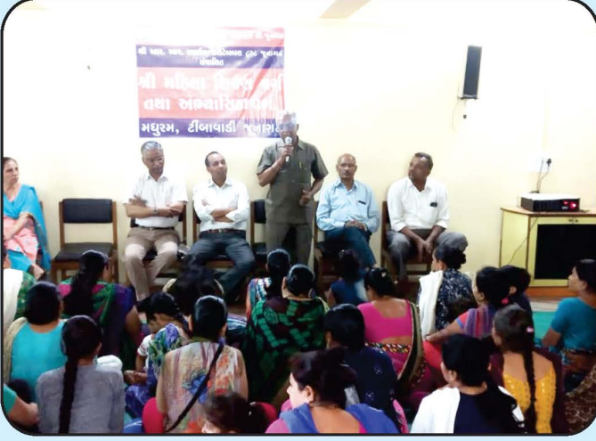
શ્રી મહિલા શિવણ વર્ગ તથા અભ્યાસિકા વર્ગ - ટીંબાવાડી શાખા Tailoring Class for Women - Timbawadi Branch