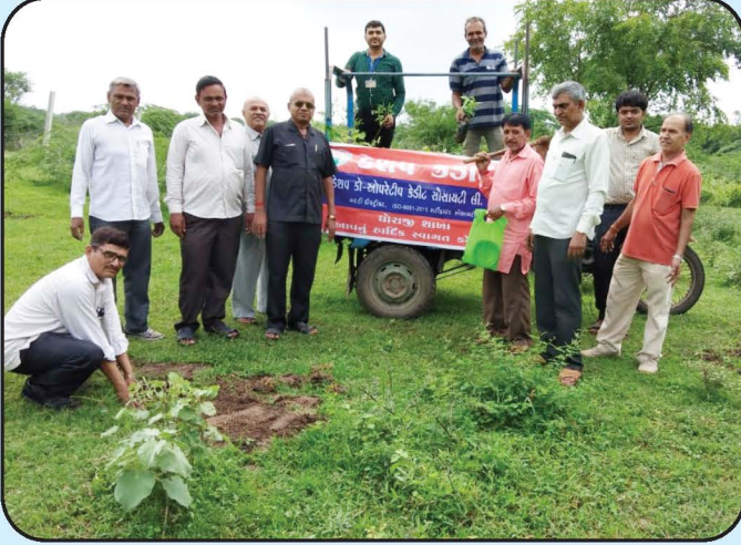
વૃક્ષારોપણ કાર્યક્રમ - ધોરાજી શાખા Tree Plantation - Dhoraji Branch