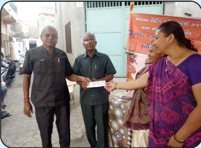
છાશ કેન્દ્ર ઉદ્ઘાટન - રાજકોટ Opening of Chhash Centre - Rajkot