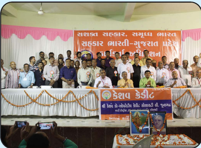
સહકાર ભારતી કાર્યકર્તા અધિવેશન - જૂનાગઢ Sahkar Bharti Karyakarta Adhiveshan - Junagadh