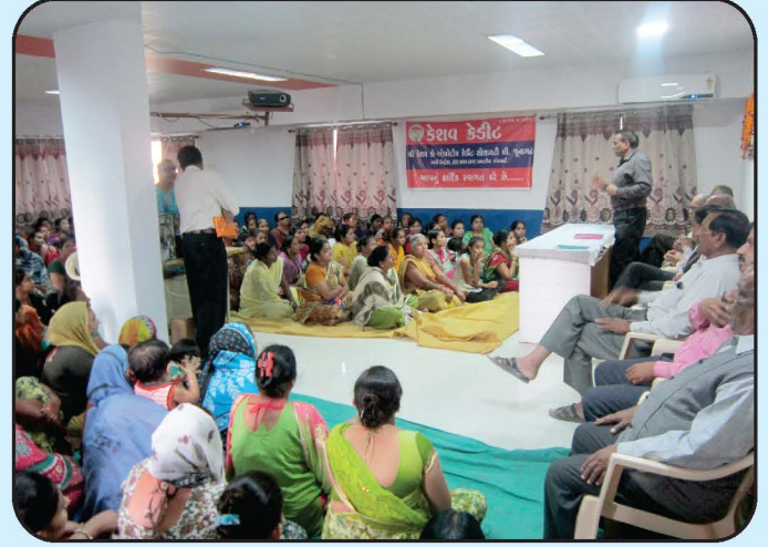
કામધેનુ ગ્રૂપ મહિલા સંમેલન - જૂનાગઢ શાખા Women Conference of Kamdhenu Loan Scheme