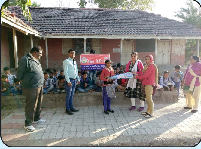
સ્પર્ધાત્મક કાર્યક્રમ - અમરેલી શાખા Competition Programme - Amreli Branch