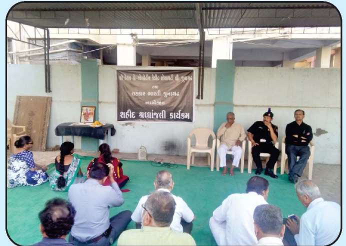
શહીદ શ્રદ્ધાંજલિ કાર્યક્રમ - જૂનાગઢ શાખા Sahid Shrdhdhanjali Program - Junagadh Branch