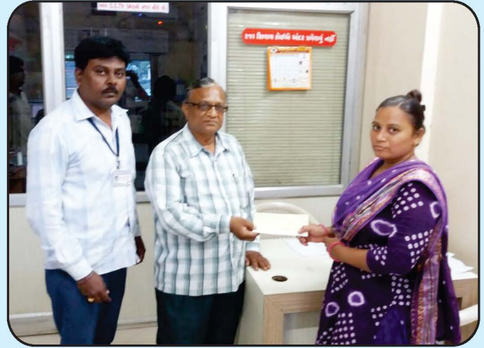
ચેક વિતરણ સભાસદ કલ્યાણ યોજના - ઉના શાખા Cheque Distribution of Sabhasad Kalyan Yojna - Una Branch