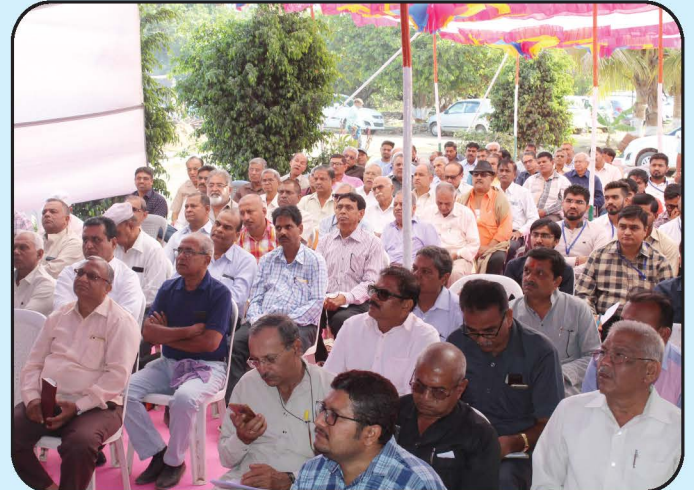
સંચાલક મંડળ અભ્યાસ વર્ગ-સાસણ Education Seminar of Management Committee