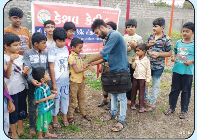
રક્ષાબંધન કાર્યક્રમ - વંથલી શાખા Rakshabandhan Festival - Vanthali Branch