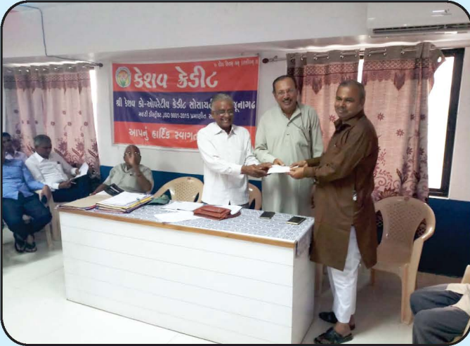
વિદ્યાભારતી આર્થિક સહાય Vidhyabharti Financial Assistance