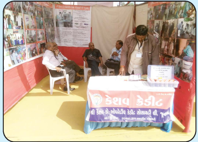
સેવા સંગમ મેળામાં પ્રદર્શન સ્ટોલ - રાજકોટ Exhibition in Sheva Sangam Fair - Rajkot