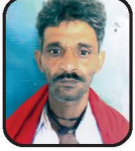
ધીરાભાઈ ખાંભલા દ્વારકા શાખા

નાના માણસોને લોન આપતી સોસાયટી માંથી લોન લઈને મે ઘરનું મકાન ખરીદ કરેલ.વાસ્તવમાં નાના માણસો માટે આ સોસાયટી ખરેખર ઉપયોગી છે.હું આ સોસાયટી ની પ્રગતી થાય તેવી આશા રાખુ છું.