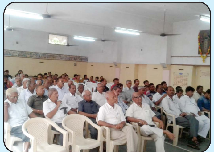
સભાસદ સ્નેહમિલન - માણાવદર શાખા Shabhasad Snehmilan - Manavadar Branch