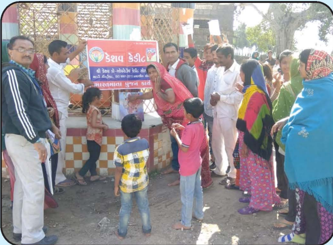
૨૬-જાન્યુઆરી, ભારતમાતા પૂજન કાર્યક્રમ - વેરાવળ શાખા 26-January, Bharatmata Pujan - Veraval Branch