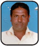
રવજીભાઈ વાણવી વંથલી શાખા

મે આ સોસાયટીની જોષીપુરા શાખા માંથી ધંધા નાં વિકાસ માટે લોન લઈ આર્થિક પ્રગતી કરેલ છે.આર્થિક રીતે પગભર થવા નાના માણસો માટે આ સોસાયટી ખરેખર ઉપયોગી છે.હું આ સોસાયટી નાં સંચાલકોનો ખૂબજ આભારી છું.