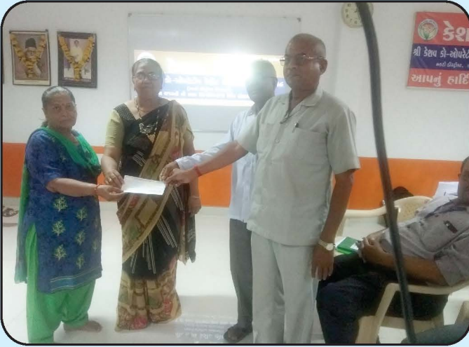
શક્તિ પ્રતિષ્ઠાન ટ્રસ્ટને આર્થિક સહાય Shakti Pratishthan Trust Financial Assistance