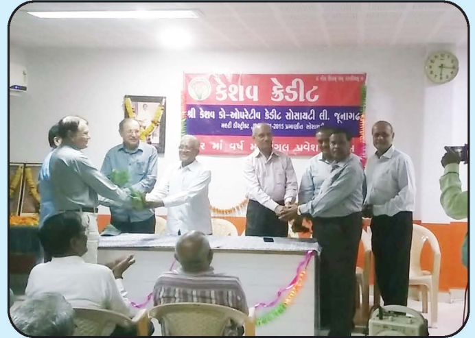
૨૨ માં વર્ષમાં મંગલ પ્રવેશ Celebration of 22 nd of Keshav Credit