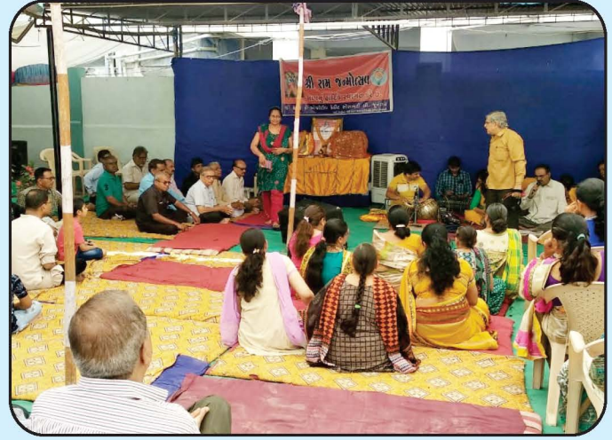
રામનવમી ઉત્સવ - જૂનાગઢ શાખા Celebration of Ramnavmi - Junagadh Branch